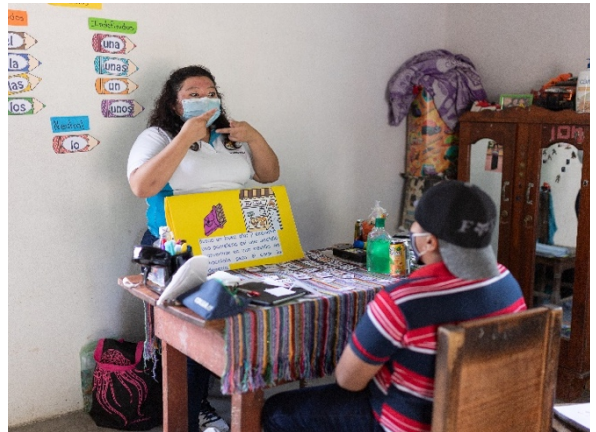
Docente dando clases a estudiante sordo en su domicilio