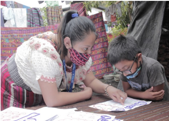
Docente dando clase a niño de baja visión

Plaza Jardín de América, 2Av. 0-60 Zona 2 Calle Rancho Grande, Panajachel- Departamento de Sololá- GUATEMALA Tfno. 00 (502) 47022297 y 41016092